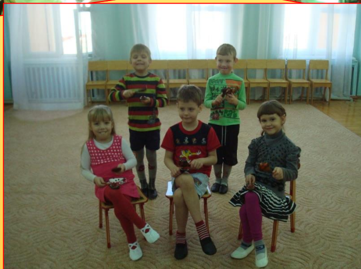
"Веселый оркестр ложкарей"